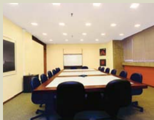
Salas de reunião para 10 e 18 pessoas