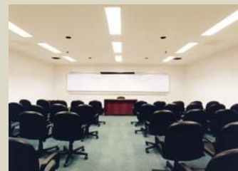
Sala de Seminários e Exposições com diferentes formatos