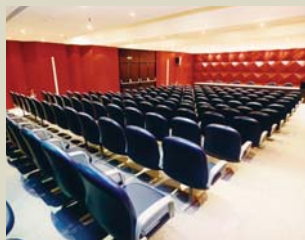
Auditório com capacidade para 150 pessoas