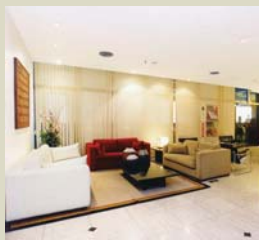
Salas de estar para coquetéis

Espaços elegantes e versáteis para o seu evento