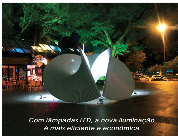
Com lâmpadas LED, a nova iluminação é mais eficiente e econômica

As lâmpadas LED são eficientes porque produzem a mesma quantidade de lúmens (fluxo luminoso) com menor gasto energético. Para gerar o equivalente a 1300 lúmens, basta uma lâmpada LED de 20 Watts, enquanto a mesma luz só pode ser gerada por uma incandescente de 70 Watts. Outra grande vantagem do LED é que sua emissão de calor é praticamente inexistente, o que auxilia na economia energética, e