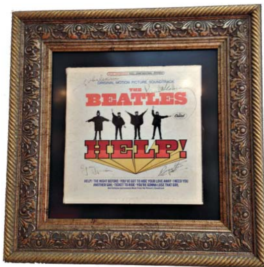
LP Help autografado

A exposição fica em cartaz até o dia 20 de março. Vale conferir!