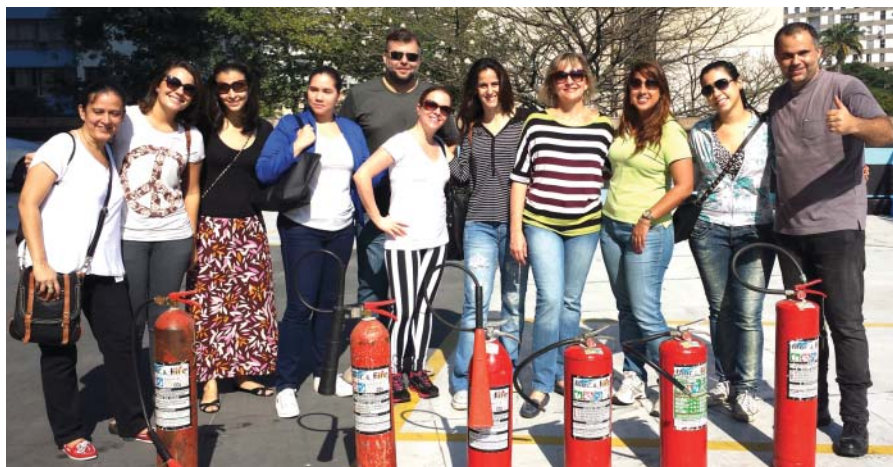
A equipe de emergência da Hydro aprendeu sobre combate a incêndio e primeiros socorros

“Os resultados foram avaliados de forma muito positiva, pois a City Fire conseguiu mobilizar e motivar bastante o grupo, que se mostrou interessado e participativo. Percebemos que os funcionários levaram o que aprenderam também para a vida pessoal, pois disseram que, vendo a importância da prevenção, iriam levantar o que poderia ser feito em casa para evitar acidentes e sinistros. Outro ponto foi justamente a palavra prevenção. A consciência que foi criada, no sentido de dar mais importância à prevenção de