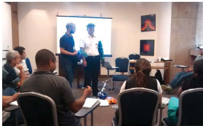
Legislação trabalhista e previdenciária, acidentes e doenças do trabalho e medidas de controle dos riscos ambientais foram temas abordados no treinamento

De acordo com o Ministério do Trabalho e Emprego, a Comissão Interna de Prevenção de Acidentes tem como objetivo a prevenção de acidentes e doenças decorrentes do trabalho, assim como a preservação da vida e a promoção da saúde do trabalhador.